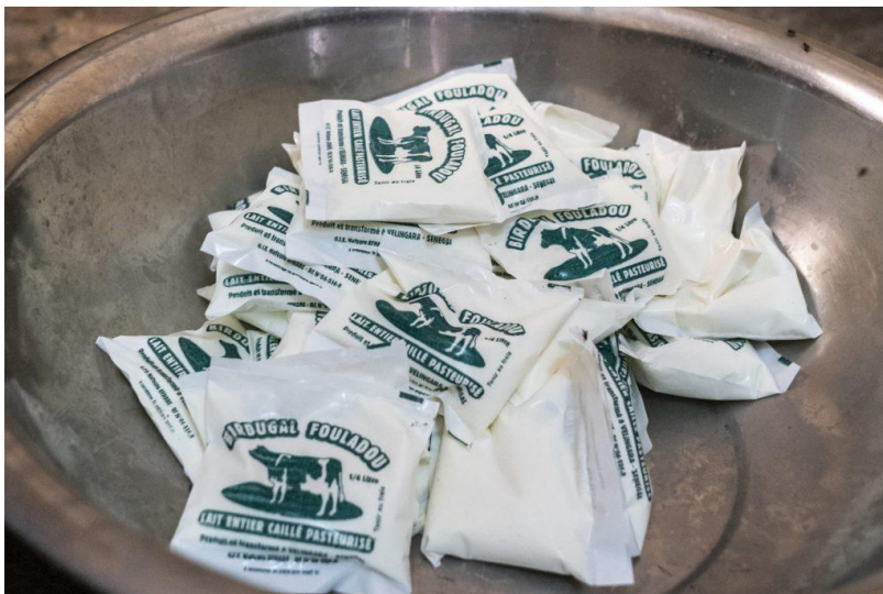
Goedkoop melkpoeder voor de Afrikaanse markt. Rr

Dat zegt ook Eddy Leloup van Milcobel. ‘Door hun zwakke productiesystemen kunnen sommige Afrikaanse landen niet zelfvoorzienend zijn. Een beleid om in de behoeften van de eigen bevolking te voorzien, blijft in die landen te lang afwezig. Dat staat los van de Europese export. Integendeel, de export brengt er soelaas en voorziet in een behoefte op de Afrikaanse markt.’