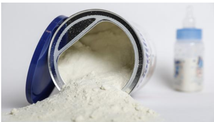
De la poudre de lait.

Mis à jour le 15/04/2019 | 11:29 publié le 15/04/2019 | 11:29