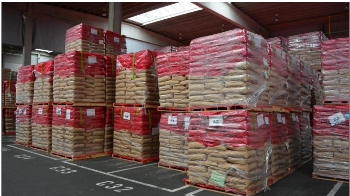
De Europese melkpoedervoorraad is de afgelopen maanden flink geslonken. - JV

De overproductie van Europese melk doet de prijzen dalen ten nadele van Europese melkproducenten, maar ook van West-Afrikaanse boeren die concurrentie ondervinden van poedermelk die minder kost dan lokaal geproduceerde melk. Afgeroomde poedermelk die opnieuw wordt verrijkt met palmolie, wat ecologische onzin is. Dat klagen de ngo's SOS Faim, Oxfam en Dierenartsen zonder Grenzen aan. Samen met Europese (European Milk Board) en Afrikaanse boeren vormen ze de coalitie "Mijn melk is lokaal".