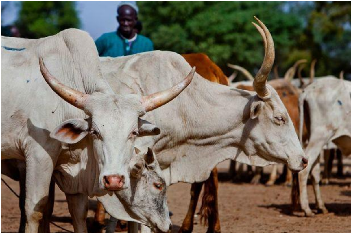
Een veeboer verkoopt zijn koeien op een markt in Senegal.

Europa dumpst melkpoeder met palmolie-extracten in West-Afrika. Rampzalig voor lokale melkboeren en funest voor de lokale consument, vindt Josti Gadeyne van Dierenartsen Zonder Grenzen (DZG).