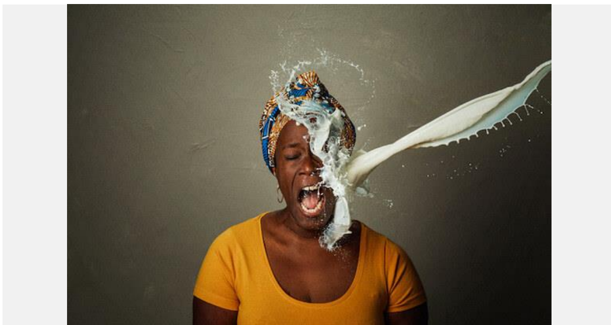
En Afrique de l'Ouest, on boit du lait à l'huile de palme, sans forcément le savoir

Face à cette concurrence à bas prix, déloyale, les éleveurs, le plus souvent des femmes, s'en trouvent lésés : le simili « lait » européen est vendu moins de 200 francs CFA contre 400 francs pour le lait local . Et pour cause, l'huile de palme, qui au passage contribue à la déforestation massive coûte douze fois moins cher que la matière grasse laitière.