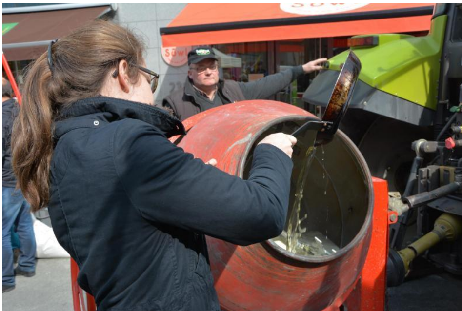
Avant son utilisation (ici, pour faire des crêpes), la poudre de lait écrémé est réengraissée avec de l'huile de palme. - J.V.

Les différents partenaires demandent encore que soit développée la production laitière locale en lieu et place d'un abaissement des droits de douane. Toutefois, François Graas, de Sos Faim, nuance : « Les importations ne doivent pas être condamnées en bloc car la production locale ne peut actuellement pas répondre à la demande en produits laitiers. » Et d'ajouter : « Il doit y avoir un équilibre et les importations à bas prix ne doivent pas dominer. Il est également nécessaire d'appuyer les structures locales via la politique de coopération au développement, car la production laitière représente un grand potentiel d'emplois et de possibilités de revenus. »