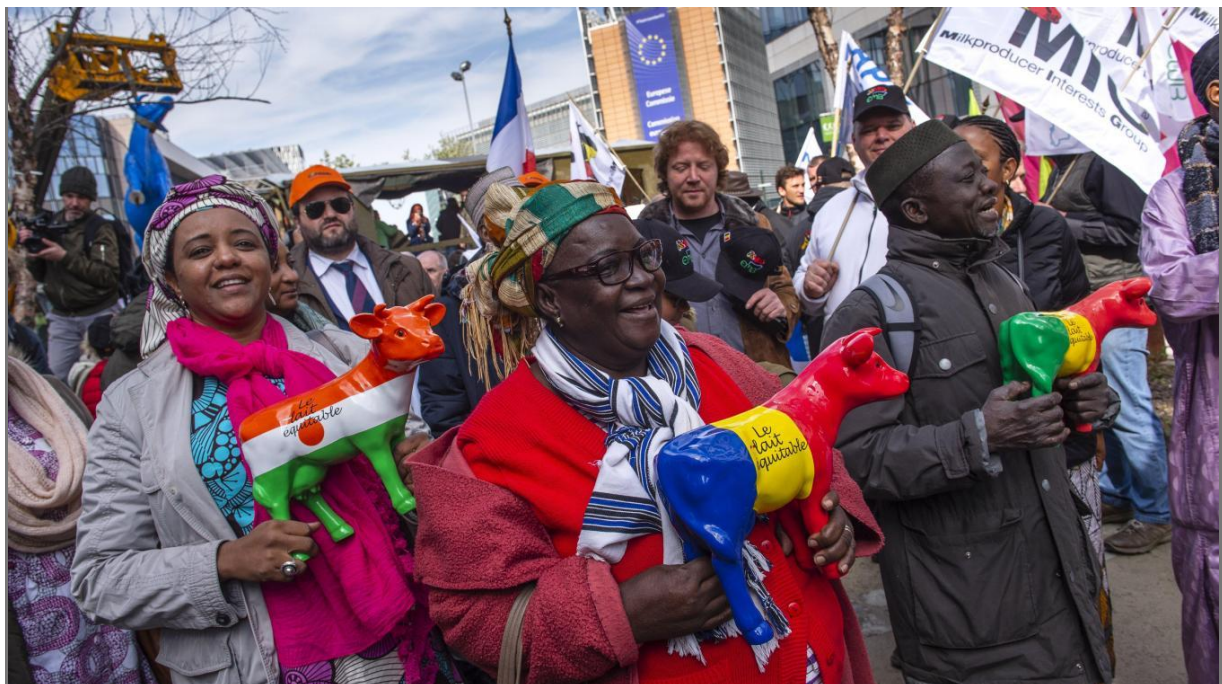
Gemeinsame Kundgebung europäischer und westafrikanischer Milchbauern in Brüssel

Dass Bauern im Brüsseler EU-Viertel demonstrieren, ist nichts Ungewöhnliches mehr. Dass aber europäische und afrikanische Milcherzeuger gemeinsam gegen Missstände, sprich Überproduktion und Dumping, protestieren, ist neu. Aber sie haben ein gemeinsames Anliegen.