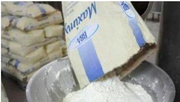
L'Europe envahit l'Afrique de poudre de lait à l'huile de palme, dénoncent des ONG

La surproduction de lait européen fait chuter les prix au détriment des éleveurs européens, mais aussi des éleveurs de l'Afrique de l'Ouest concurrencés par de la poudre moins chère que le lait local. Une poudre de lait écrémé réengraissée à l'huile de palme, un non-sens écologique, dénoncent SOS Faim, Oxfam et Vétérinaires Sans Frontières avec des éleveurs d'Europe et d'Afrique de l'Ouest réunis respectivement dans l'European Milk Board et la coalition " Mon lait est local ".