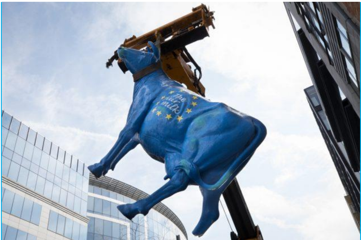
Protestaktion der Milchbauern am 10.4. im Brüsseler Europaviertel

Im Europaviertel in Brüssel haben am Mittwochvormittag europäische und westafrikanische Milchbauern gemeinsam gegen die europäische Agrarpolitik demonstriert.