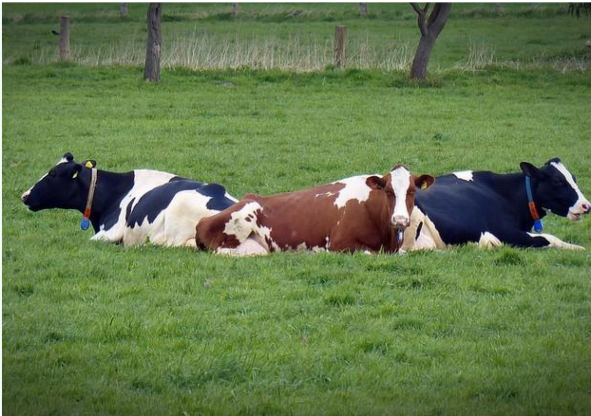
Mucche da latte

Redazione ANSA ROMA 10 aprile 2019 16:22